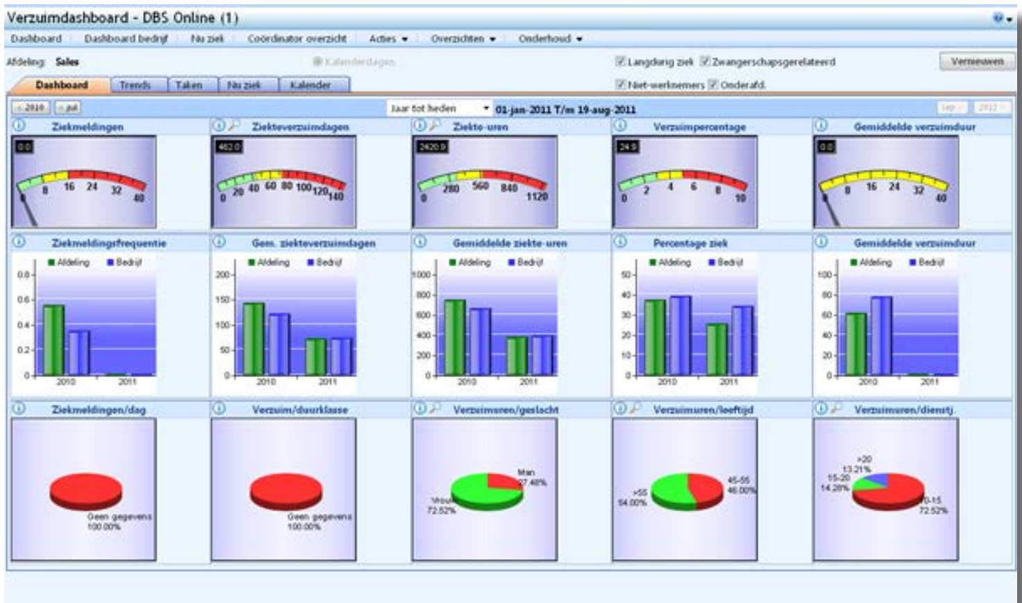
dashboard: alle ken- en stuurgetallen op een rij